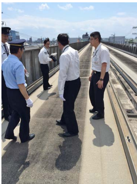
車両火災乗客避難訓練

車両火災を想定した乗客避難訓練および地震発生時における乗客の公共避難場所への誘導訓練を実施しました。