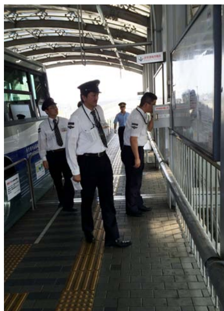
地震時乗客避難誘導訓練