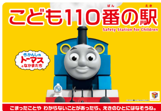
大曾根駅の「こども110番の駅」ステッカー

(社)日本民営鉄道協会の呼びかけによる「こども110番の駅」として、引き続き平成25年度も大曾根駅にステッカーを掲示して対応してまいりました。