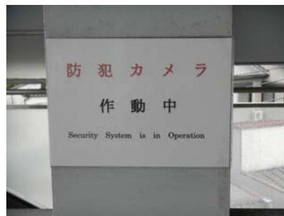
掲示したテロ対策・防犯ポスター