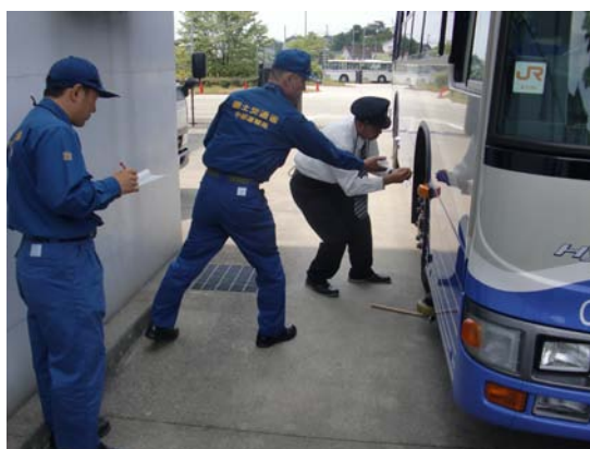
無軌条電車運転免許試験