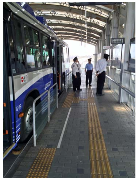
地震時乗客避難誘導訓練