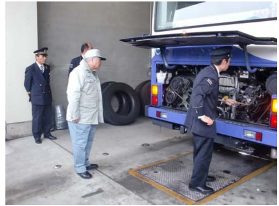
車両日常点検状況視察