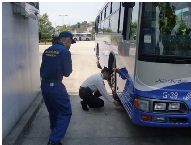
無軌条電車運転免許試験