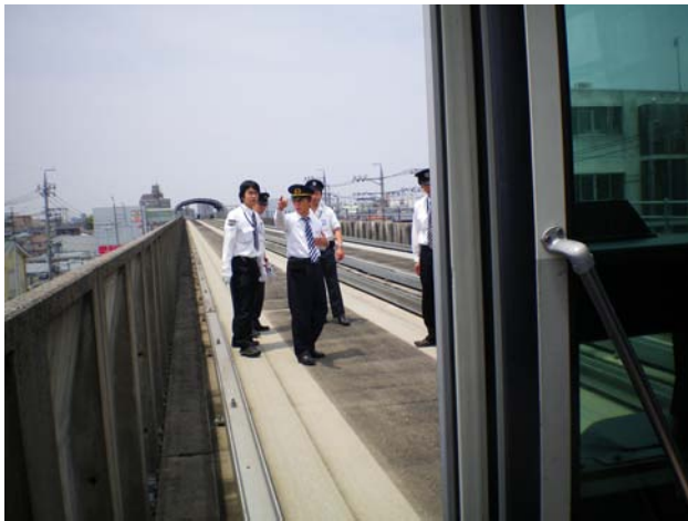
車両火災乗客避難訓練

車両火災を想定した乗客避難訓練および地震発生時における乗客の公共避難場所への誘導訓練を実施しました。