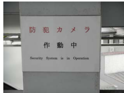
掲示したテロ対策・防犯ポスター