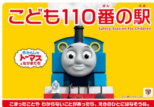
大曽根駅の「こども110番の駅」ステッカー

(社)日本民営鉄道協会の呼びかけによる「こども110番の駅」として、引き続き平成26年度も大曽根駅にステッカーを掲示して対応してまいりました。