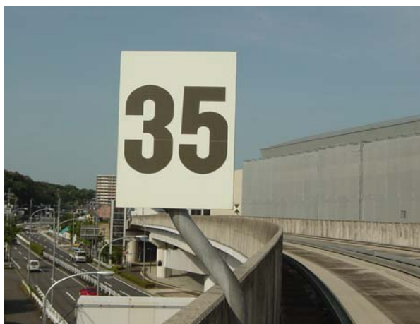
更新した蓄光式標識

平成 21 年 12 月に老朽化して視認性が悪くなった速度制限標識・制限解除標識を薄暮でも見やすい蓄光式の標識に更新しました。