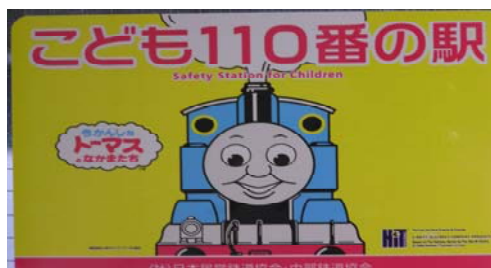
大曾根駅の「こども110番の駅」ステッカー

(社)日本民営鉄道協会の呼びかけによる「こども110番の駅」として、引き続き平成21年度も大曾根駅にステッカーを掲示して対応しております。