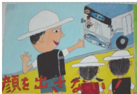
児童生徒が描いたポスターの一例