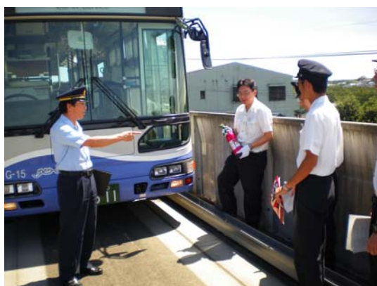
車両火災乗客避難訓練

車両火災を想定した乗客避難訓練および車両の運行不能時の後続車両との連結による推進運転の訓練を 8 月に 5 回に分けて実施しました。