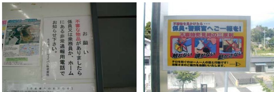
掲示したテロ対策・防犯ポスター