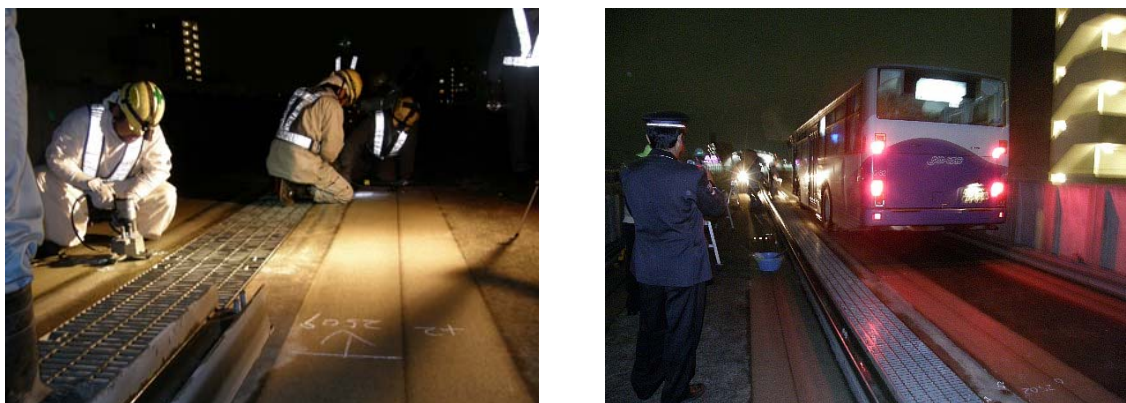
非常亙り線回送訓練

本線路上で車両が運行不能となり、他の車両を非常亙り線を設置して回送することを想定し、平成21年11月13日終車後線路閉鎖を実施し、非常亙り線の設置とそれを使用した回送訓練を実施しました。