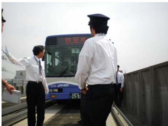
車両火災乗客避難訓練

車両火災を想定した乗客避難訓練および車両の運行不能時の後続車両との連結による推進運転の訓練を実施しました。