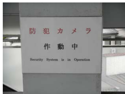
掲示したテロ対策・防犯ポスター