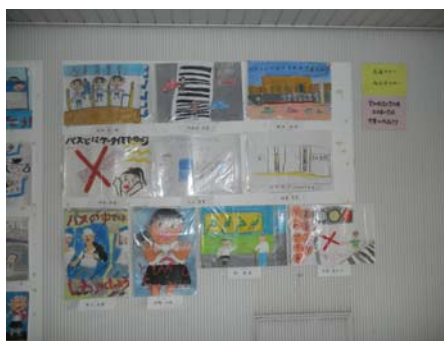
児童生徒が描いたポスターの一例