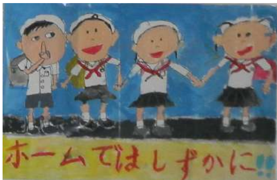
児童生徒が描いたポスターの一例