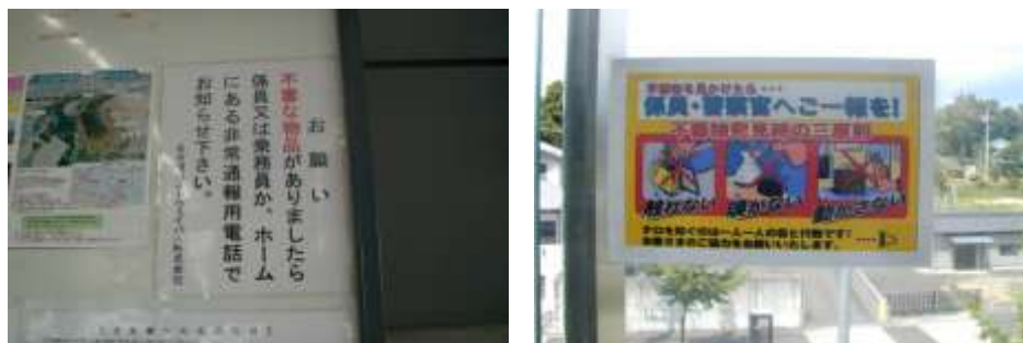
掲示したテロ対策・防犯ポスター