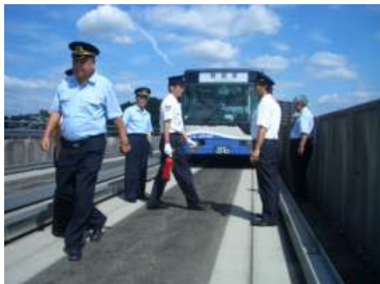
車両火災乗客避難訓練

車両火災を想定した乗客避難訓練および車両の運行不能時の後続車両との連結による推進運転の訓練を実施しました。