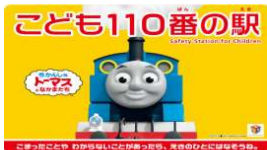
大曽根駅の「こども110番の駅」ステッカー

(社)日本民営鉄道協会の呼びかけによる「こども110番の駅」として、引き続き平成22年度も大曽根駅にステッカーを掲示して対応しております。