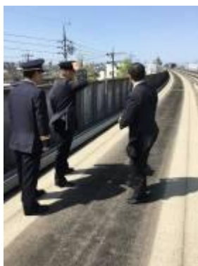
車両火災乗客避難訓練

車両火災を想定した乗客避難訓練及び地震発生時における乗客の公共避難場所への誘導訓練を実施しました。