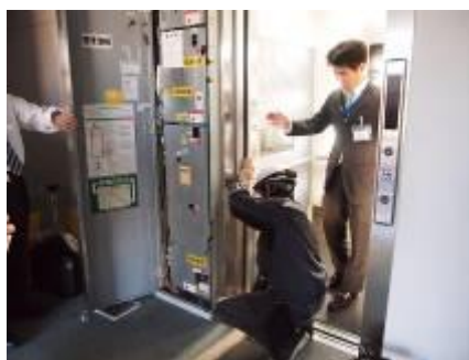
エレベーター閉じ込め時の対応訓練

エレベーターの故障等により、お客さまの閉じ込めが発生した場合の対応を行う訓練を実施しました。