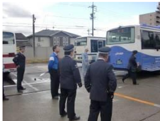
車両日常点検状況視察