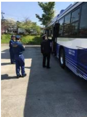
無軌条電車運転免許試験

新たに4人の無軌条電車運転免許取得教習を行いました。平成29年3月末で、無軌条電車運転免許取得者は、計72名です。