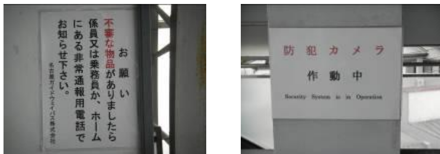
掲示したテロ対策・防犯ポスター

公共交通機関へのテロ対策、防犯ポスターを各駅、管理センターに掲示し、利用者等への協力を要請しました。